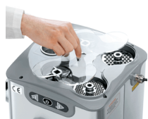
Compartment for knives and plates