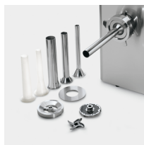
Optional stuffer kit