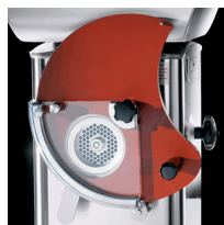
Optional patty former