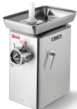
Sirman Мясорубки , model TC 32 Barcellona :

Sirman Spa Viale dell'Industria 9/11 35010 PIEVE DI CURTAROLO (PD), Italy Tel./Fax. +39 049 9698666 / +39 049 9698688 email: info@sirman.com