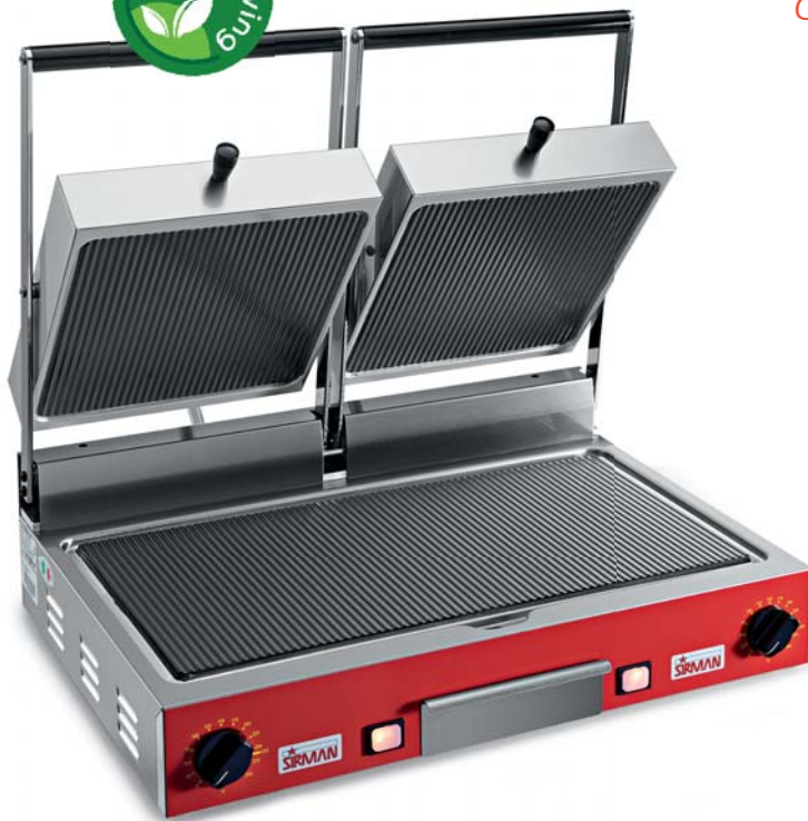
PD VC RR-RR