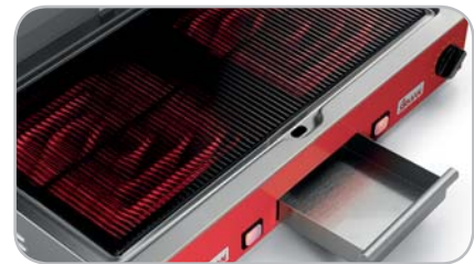
Cassetto raccolta liquidi e residui di cottura Useful drip tray for liquids and other cooking leavings.