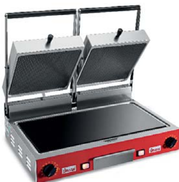
PD VC LR-LR