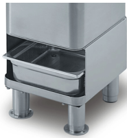
Optional trestle with sieve