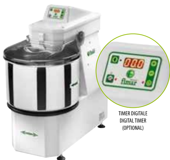
TIMER DIGITALE DIGITAL TIMER (OPTIONAL)

SPIRAL KNEADER PETRISSEUSE A SPIRALE SPIRALENTEIGKNETMASCHINE AMASADORA CON ESPIRAL СПИРАЛЬНЫЙ ТЕСТОМЕС