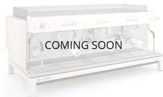
EX3 3GR КНОПОЧНОЕ УПРАВЛЕНИЕ