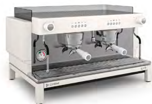
EX3 2GR КНОПОЧНОЕ УПРАВЛЕНИЕ