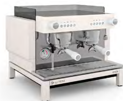
EX3 MINI 2GR КНОПОЧНОЕ УПРАВЛЕНИЕ