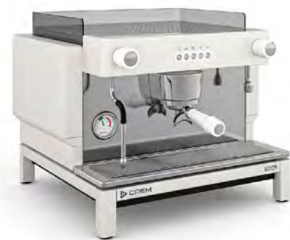
EX3 MINI 1GR КНОПОЧНОЕ УПРАВЛЕНИЕ