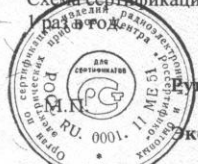
Схема сертификации №3а. Инспекционный контроль за сертифицированной продукцией